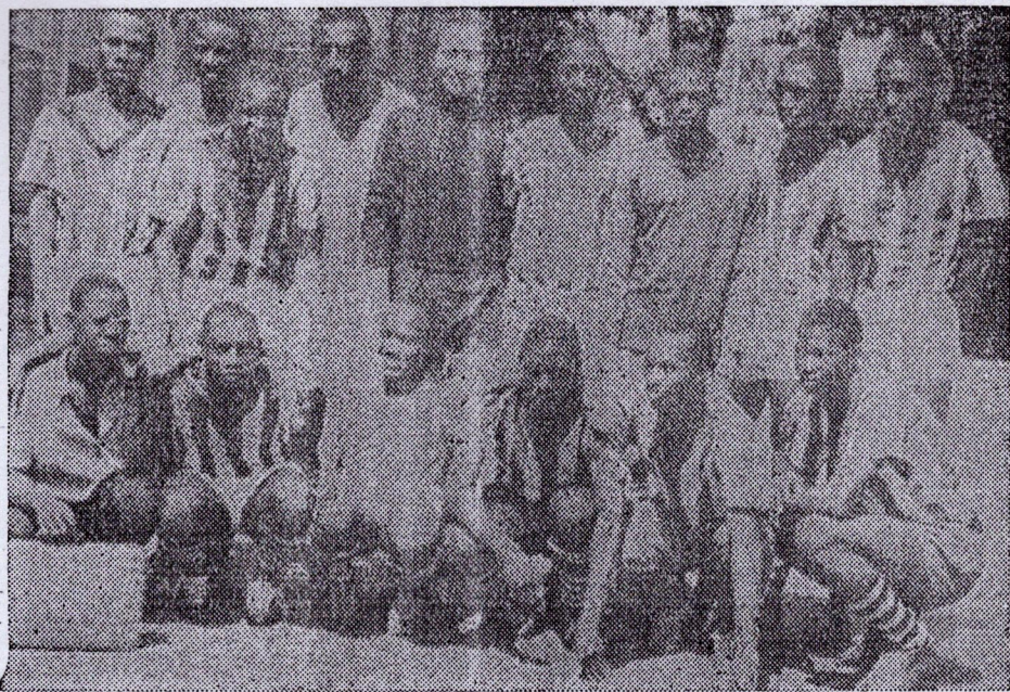
LES EQUIPES FEDERALES DE CONAKRY-I

me de Kindia, Dubréka, etc... Ce rendez-vous qui se préparait depuis plusieurs semaines devait être à la hauteur de l'espérance des spectateurs. C'est donc dans une atmosphère particulièrement effervescente que la rencontre d'hier s'est déroulée. Mais comme au moment où nous mettions sous presse ces quelques lignes le match n'avait pas commencé, nous vous invitons, chers lecteurs à lire notre commentaire sur cette importante rencontre dans notre prochaine édition